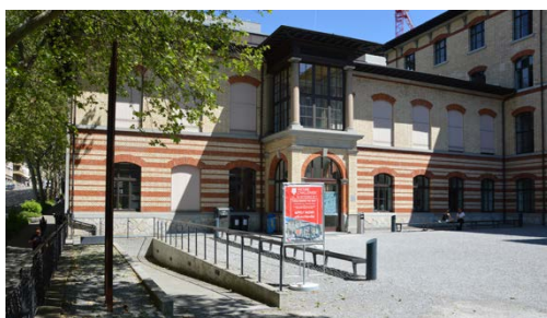
Oben: CAB Kiesplatz links Rampe Unten: CAB Kiesplatz rechts