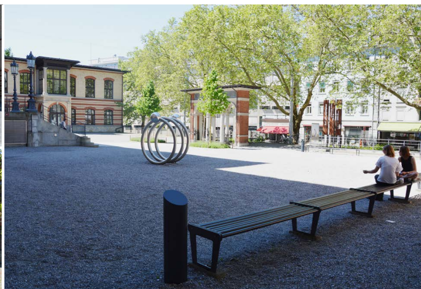
CAB Kiesplatz links

ETH Zürich Abteilung Campus Services Bewilligungen Binzmühlestrasse 130 8092 Zürich